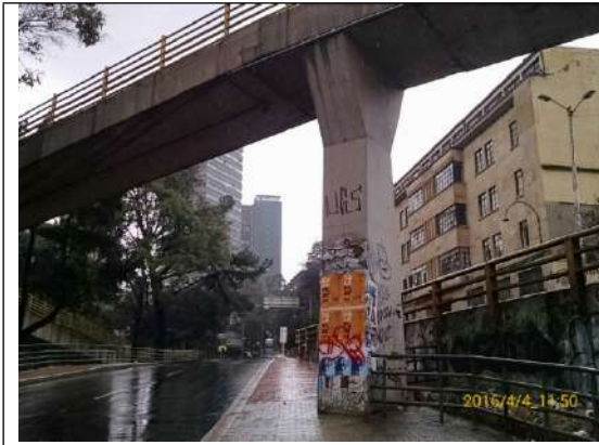
Calle 26 con Carrera 5.