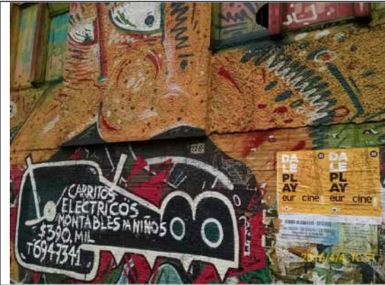
Av. Caracas No. 22-84