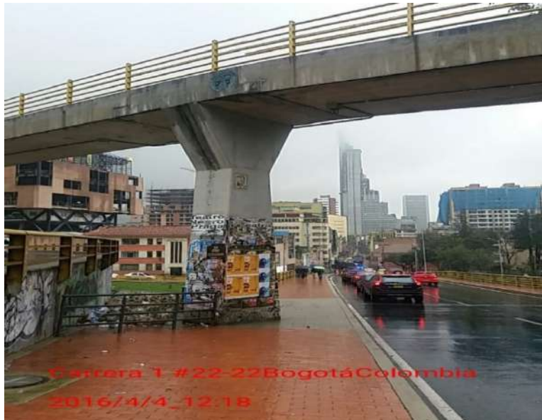
Fotografía 1. Columna Puente de la Calle 26 con Carrera 5 sentido norte – sur