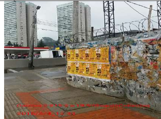
Calle 20 con Carrera 3