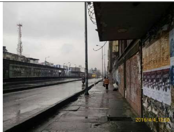
Av. Caracas con Calle 22