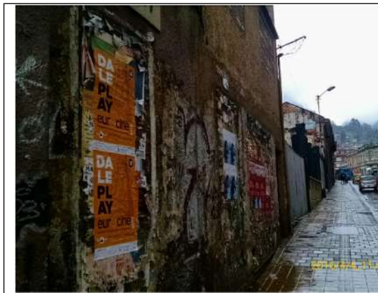
Calle 24 con Carrera 5