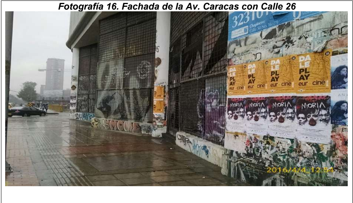
Fotografía 16. Fachada de la Av. Caracas con Calle 26

ALCALDÍA MAYOR DE BOGOTÁ D.C. SECRETARÍA DE AMBIENTE