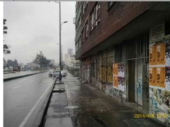
Av. Caracas con Calle 24