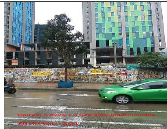
Calle 19 con Carrera 3