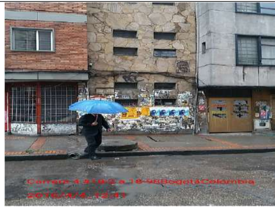
Calle 18 con Carrera 4