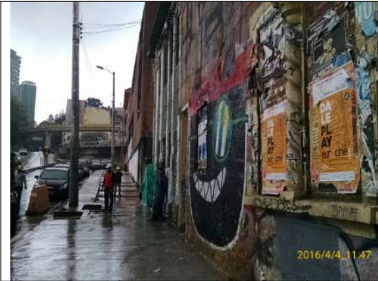
Carrera 5 No. 24-04